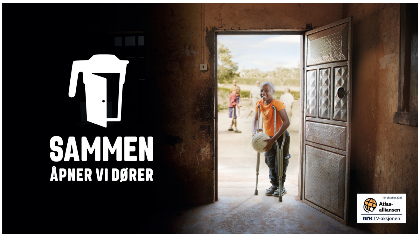
Sammen åpner vi dører var navnet på TV-aksjonen 2025.