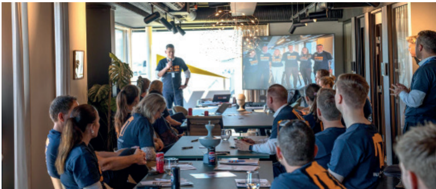
Næringslivet bidrar vesentlig hvert år. Bildet er fra ringedugnaden i Kristiansand, hvor næringslivet selv kontakter andre bedrifter for å be om støtte til TV-aksjonen.