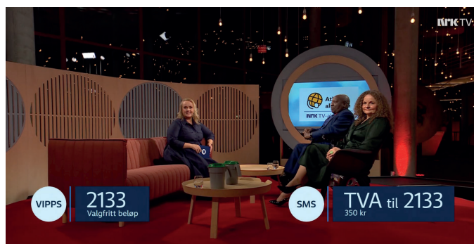
TV-sendingen er fortsatt en viktig del av TV-aksjonen, og ble vist på NRK fra kl. 20-23 kvelden etter aksjonsdagen.

Selv om antall seere har gått ned siden 2024, så er det samme andel av alle som ser på TV som ser på sendingen om TV-aksjonen. I tidsrommet TV-sendingen ble sendt kom det inn om lag 27 millioner kroner, noe av dette skyldes andre forhold enn selve TV-sendingen som f.eks. forsinket gaver fra bøsseene eller fra kampanjen.