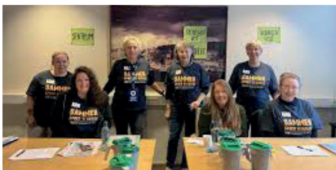
Kommunene er ryggraden i TV-aksjonen og gjør at organisering skjer lokalt. Her fra Larvik kommune.

Alle kommuner i Norge hadde aktivitet knyttet til TV-aksjonen i 2025. Kommunenes innsats er avgjørende, de organiserer lokale komiteer, rekrutterer bøssebærere og sørger for at aksjonen når ut i hele landet. 30 kommuner har valgt å fokusere på næringsliv og skoler fremfor fysisk bøsseaksjon; disse samler inn noe mindre enn de med fysisk bøsseaksjon. I mange av kommunene er det ildsjeler fra frivilligsentralene som organiserer TV-aksjonen lokalt.