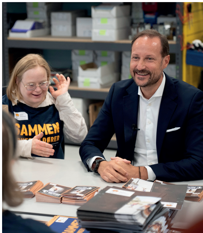
Kronprins Haakon var høy beskytter i 2025. Han besøkte blant annet Fossheim, en tilrettelagt bedrift som brukes for å sende ut materiell for TV-aksjonen.

Kongefamilien har vært beskyttere for TV-aksjonen siden starten i 1974. I 2025 hadde H.K.H. Kronprins Haakon denne rollen. Kronprinsen besøkte den tilrettelagte bedriften Fossheim, der de ansatte har pakket materiell for TV-aksjonen de siste 11 årene, og møtte også en familie fra som hadde flyktet fra Ukraina til Norge, der faren er rullestolbruker. Begge besøkene ble formidlet i TV-aksjonsendingen på NRK.